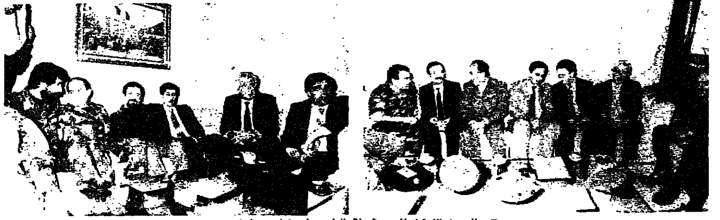
جانب من الاجتماع لتوسيع في منزل الرئيس رشيد كرامي مساء امس (محمود الطويل)